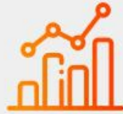
Análitica de impactos publicitarios