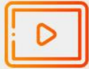
Pantalla de 22" 1920 x 1080