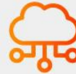
Sistema de comunicación IOT